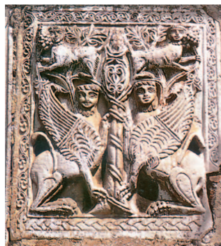
Ανάγλυφη εντοιχισμένη πλάκα (Ι.Ν. Παναγίας της Γοργοεπηκόου, Αθήνα).