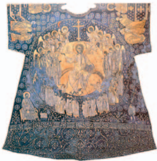
Βυζαντινός χρυσοποίκιλτος επισκοπικός σάκκος του 15ου αι. (Βατικανό, Θησαυρός του Αγίου Πέτρου).