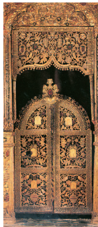
Ξύλινη σκαλιστή είσοδος ιερού ή βημόθυρο (Ι. Μ. Μεγάλου Μετεώρου).